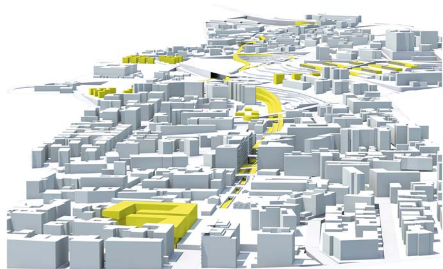
VISTA GENERALE DI PROGETTO il percorso ciclopedonale e le aree limitrofe, dalla stazione di borgo verso ovest