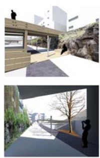
SEQUENZE DI PROGETTO LUNGO IL PERCORSO CICLOPEDONALE